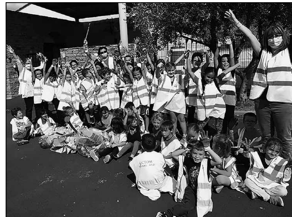
Vendredi 18 septembre les enfants de l'école ont nettoyé les abords de l'école.

Vous donnez votre numéro de téléphone portable en mairie avec la liste de vos trajets. Ce numéro ne sera transmis qu'aux personnes intéressées et qui résident dans la commune. Vous trouverez la liste des trajets sur le site et à la mairie,